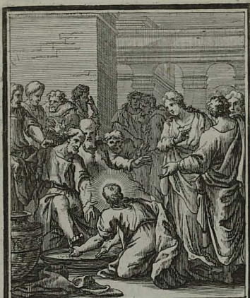
9. IOHANN. XIII. 4. 5. Discipulorum pedes lavat, & re- nuenti Petro lotionis necessita- tem demonstrat. Cum Pr. S. C. M. C. Weigel.