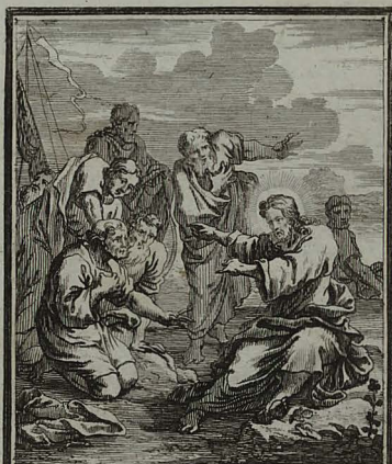
96. IOHANN. XXI. 15. 16. 17. Trinavice de amore Christi qua- litus Petrus, toties respondens, amorem erga ipsum profiteitur.