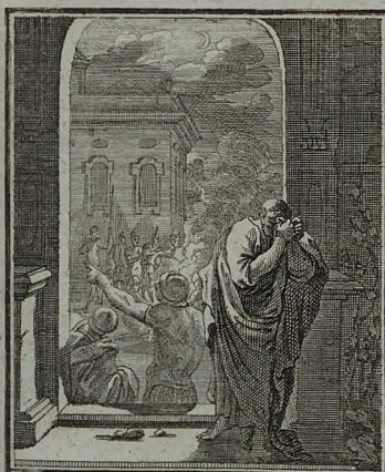
31. MATTH. XXVI. 75. Petrus denique verborum JESU recordatus, confesum foras est egressus, & flevit amare. Cum Pr. Sp. C. M. C. Weigel.