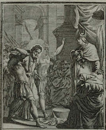
29. IOHANN. XVIII. 22. JESUS captus & vincetus coram summo Sacerdote, ob professam veritatem, a servo alapis cæditur. C. Weigel.