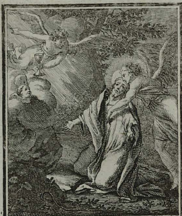
18. LUC. XXII. 43. Ad Patrem suum flexis genibus oranti, apparet angelus de celo, confortans eum.