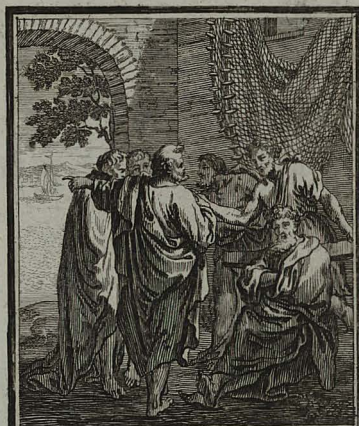
88. IOHANN. XXI. 5. Petrus cum Thoma, aliisq; disci- pulis ad mare Tiberiadis, pesca- rum ire constituit. Cum Pr. S. C. M. C. Weigel.