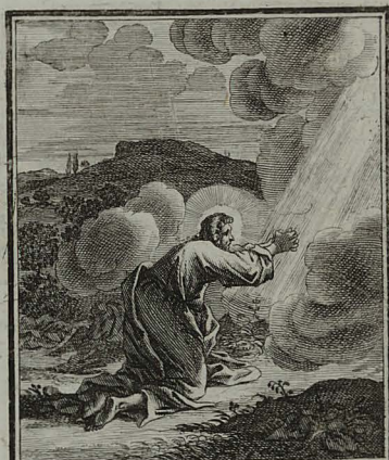
20. MAT. TH. XXVI. 44. Reliquit dormientes & sopitos iterum discipulos suos, abiit & oravit tertia vice.