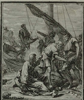
94. IOHANN. XXI. 12. JESUM ad prandendum discipu- los invitantem, nemo tamen in- terrogare audeat, quis sit. C. Weigel.