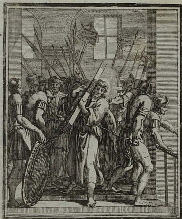
51. MATTH. XXVII. 31. JESUS Chlamyde exutus, & vestem rursus indutus, crucifigen- dus educitur. Cham. Peric. 1. 5. C. M. C. Weigel.