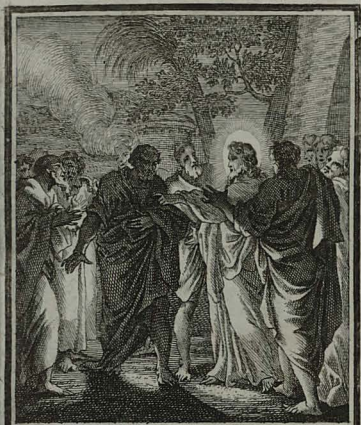
13. MATTH. XXVI. 32, 34. Christo lapsum discipulorum praedicienti, Petrus contradicit: cuius trinitam abnegationem praefagit. Cum Pr. P. S. C. M.