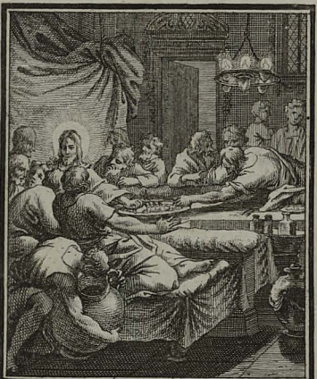
7. MATTH. XXVI. 23. 25. Discumbit cum duodecim Jesus, & edentibus illis, proditorem suum certo signo indicat. Cum Pr. S. C. M. C. Weigel