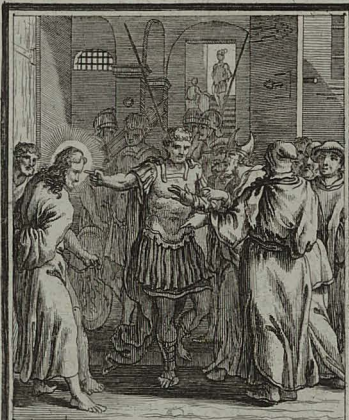
39. IOHANN. XVIII. 28. 52. Pilatus de crimine Christi qua- rens Judais eum tradit, ut secun- dum legem suam iudicent illum. C. Weigel