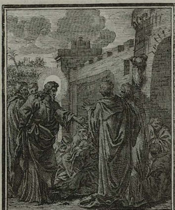
14. MATTH. XXVI. 30. Venit in villam Gethsemane, & dicit discipulis: sedete hic, donec vadam illuc, & orem. Cum Pr. S. C. M. C. Weigel.