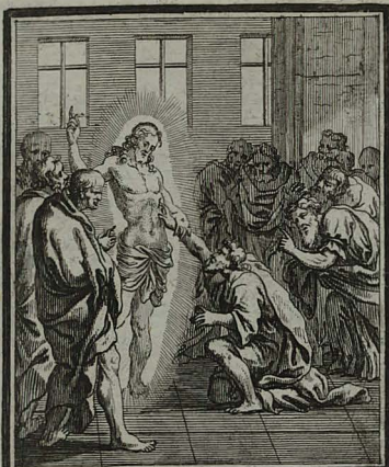
84. IOHANN. XX. 29. 29. Increduli Thomæ digitum ma- nibus suis, & manum ejus lateri suo inferit. Cum Pr. S. C. M. C. Weigel.