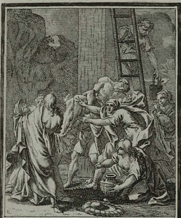
65. LUC. XXIII. 53. Corpus JESU involvitur sudone, & deponitur à Josepho in monu- mento recens exciso.