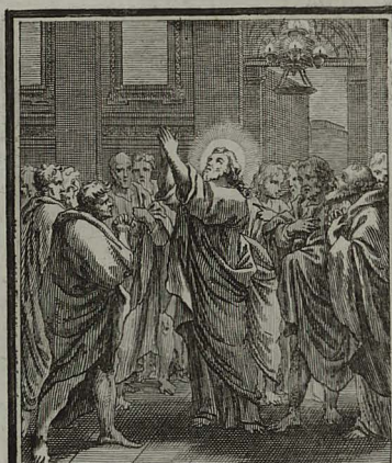
12. IOHANN. XVII. 17. Sublevatis oculis dicit: Pater venit hora glorifica Filium tu- um, ut & filius te glorificet. Cum Pr. S. C. M. C. Weigel.