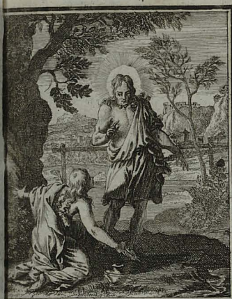
MARC. XVI. 9. JESUS summo mane e monumento à mortuis resurgens, apparuit primo Maria Magdalena. C. Weigel.