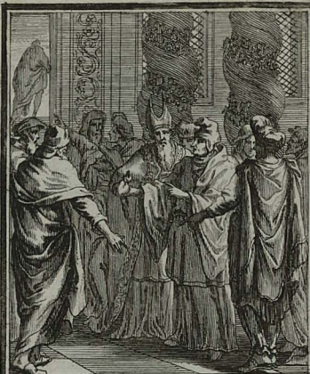
38. MATTH. XXVII. 6. Summi Pontifices, inito consilio, pro mercede proditoris figu- li agrum emunt C. Weigel