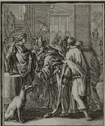
68. MATTH. XXVII. 62. Sacerdotum Principibus & Pha- risæis, custodian sepulchri expe- tentibus, Pilatus satisfacit.