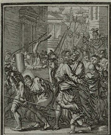
53. LUC. XXIII. 26. 32. JESUS ad turbas, & mulieres dicit: ne desite me, sed vosmet & filios vestros. Cum Pr: 15. C. M. C. Weigel