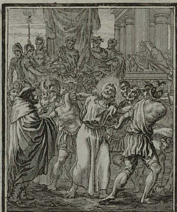
50. MATTH. XXVII. 24. 26. Pilatus lotis manibus innocen- tiam suam testatus, tradit Chri- stum, ut crucifigatur. Cham. Peric. 1. 5. C. M. C. Weigel.