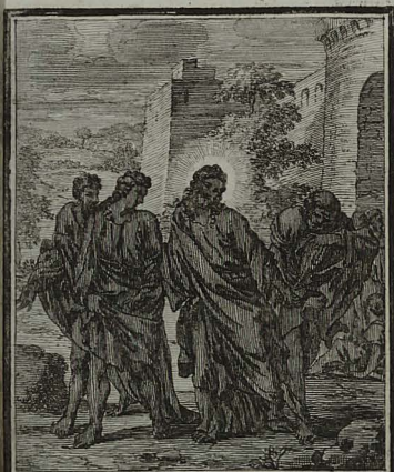
15. MATTH. XXVI. 37. Assuntio Petro & duobus filiis Zebedaei, ait: Tristis est anima mea usque ad mortem. Cum Pr. S. C. M. C. Weigel.