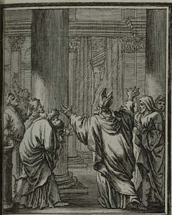
51. LUCÆ. XXIII. 45. JESU moriente, scissum est ve- lun templi in duas partes, à sum- mo usque ad imum. C. Weigel.