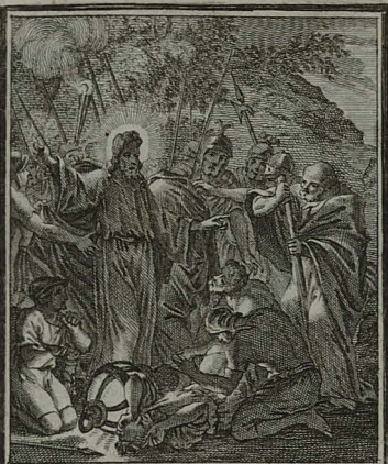
25. MATTH. XXVI. 53. Atti Petro: Convertite gladium in locum suum, nam accipientes gladium, gladio petibunt. C. Weigel.