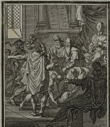
80. MATTH. XXVIII. 15. Judaeorum proceres mutam dant pecuniam custodibus, ut JESUM raptum e sepulchro divulgent. Cum Pr. S. C. M. C. Weigel.