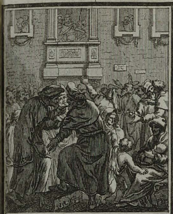
45. MATTH. XXVII. 20. Principes Sacerdotum & Seniores perfulserunt turbis, ut peterent Barabam, Jesum vero penderent.