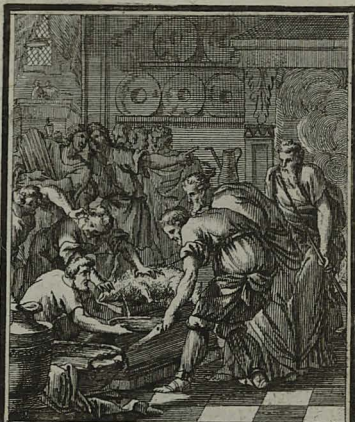
5. MATTH. XXVI. 19. Faciunt discipuli sicut coordina- verat JESUS & parant Pascha. Cum Pr. S. C. M. C. Weigel