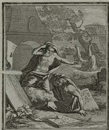
52. MATTH. XXVII. 52. JESU mortuo, terra movetur monumenta aperiuntur, & multi sancti resurgunt. C. Weigel.