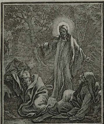
17. LUCE. XXII. 45. 46. Dormientes præ tristitia discipulos, è somno excitat, adque orationem oraviter cohortatur.