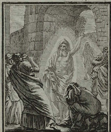
71. MATTH. XXVII. 53. Multi sancti de monumentis ex- euntes, veniunt in sanctam civi- tatem, & apparent multis.