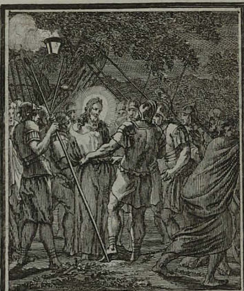
26. MATTH. XXVI. 53. 56. Iesus dixit turbis: tanquam ad la- tronem exiistis cum gladiis et ful- tibus comprehendere me. C. Weigel.