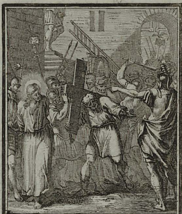
52. LUCA. XXIII. 26. Simonem Cyrenarum apprehen- dentes, imponunt illi crucem, post JESUM portandam. Cham. Peric. 1. 5. C. M. C. Weigel.