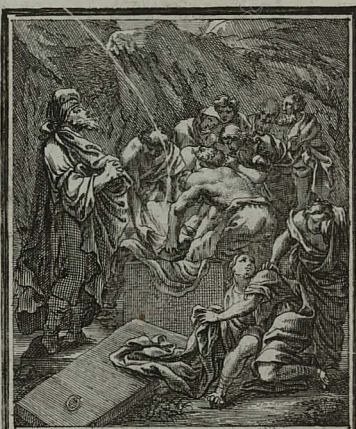
66. IOHANN. XIX. 39. 42. Nicodemus ferens mixturam myrrhæ & aloes, corpus linteis involutum more Ebræo sepelit.