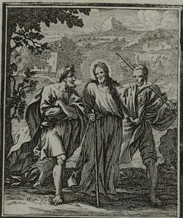
81. LUC. XXIV. 15. 16. Jesus in vicum Emmaus ambulans, duobus discipulis ob mortem suam tristibus, scripturam explicat. Cum Pr. S. C. M. C. Weigel.