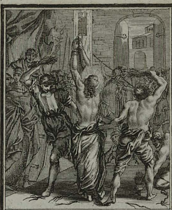
46. IOHANN. XIX. 1. Acceptit Pilatus JESUM, mili- tibusque suo more flagellan- dum tradidit.