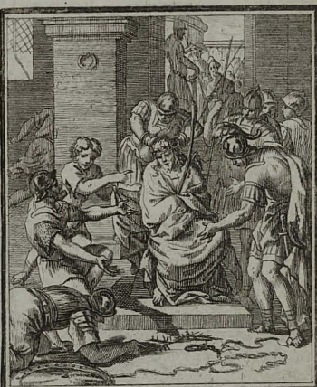
48. IOHANN. XIX. 2. Spinis coronatum, vesteque pur- purea amictum, milites ludibri- di Regem Judæorum salutant.