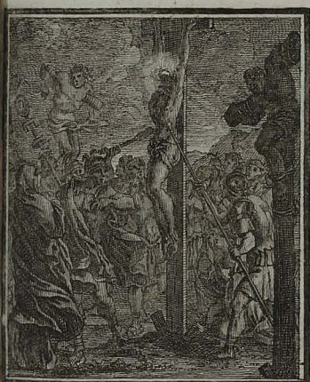
53. IOHANN. XIX. 32. 35. Eractis latronum crucibus, JESU jam mortuo, unius militum lan- cea ejus latus aperit. C. Weigel.