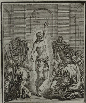
87. LUC. XXIV. 42. 43. IESUS discipulis scripturæ sen- suum aperit, & eos Hierosolymis præstolari jubet. Cum Pr. S. C. M. C. Weigel.