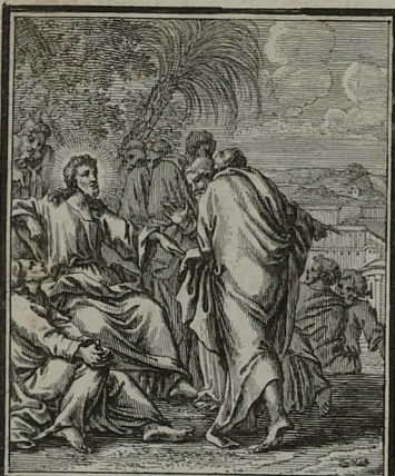
4. MATTH. XXVI. 17. 18. Quarentes discipulos de loco com- edendi pascha. JESUS incivi- tatem proximam ablegat. C. Weigel