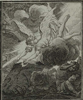
72. MATTH. XXVIII. 2.3. Facto terræmotu magno, ange- lus Domini descendit de cælo, re- volvens lapidē & sedens super illo.