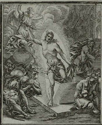
70. LUC. XXIV. 7. Custodibus perterritis, JE- SUS tertia die Victor glo- riosus refugit.