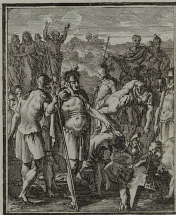
56. MATTH. XXVII. 37. Imposuerunt super caput ejus causam mortis scriptam JESUS NAZARENUS REX JUDÆORUM. Cum Pr: 15. C. M. C. Weigel