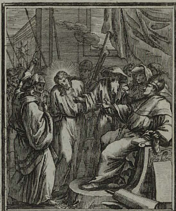
32. MATTH. XXVI. 80. De testimonio, quod duo falsi testes exhibent, a summo sacer- dote quaesitus, nihil respondet. C. Weigel.