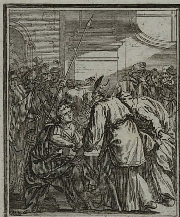
55. IOHANN. XIX. 16. Scribit Pilatus titulum Græcis: & posuit super crucem, JESUS NAZARENUS REX JUDÆORUM. Cum Pr: 15. C. M. C. Weigel