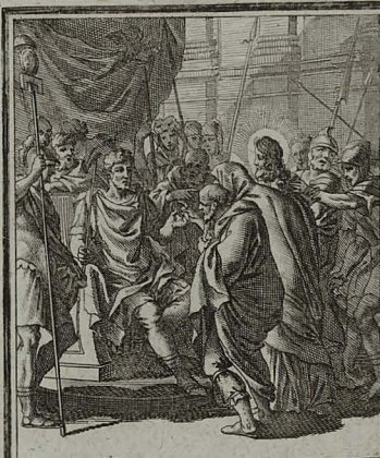
40. LUC. XXIII. 1. 5. Coram Pilato accusatur, ac si- gentem subverterit, & prohibue- rit Casari tributa dare. C. Weigel