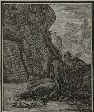
67. MATTH. XXVII. 61. Maria Magdalena, una cum alte- ra Maria, tumultato JESU, contra sepulchrum, sedent.