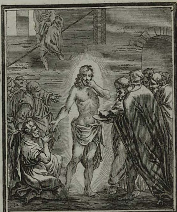
85. LUC. XXIV. 42. 43. JESU ex discipulis quærenti, num cibum habeant? offertur pi- sci allus & favum mellis. Cum Pr. S. C. M. C. Weigel.