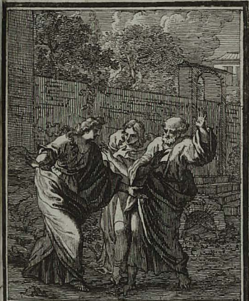
75. IOHANN. XX. 2. Currentes Maria Magdalena disci- pulis indicat, DOMINUM suum e monumento raptum. Cum Privileg. S. C. M. C. Weigel.