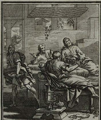
83. LUC. XXIV. 29. 30. JESUS panem benedictum & fractum porrigit, ab Emmauiticis discipulis agnoscitur. C. Weigel.