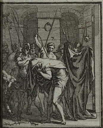
47. MATTH. XXVII. 28. Miles in pratorio JESUM exuentes, circumdederunt ei pal- lium purpureum.