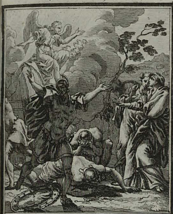
73. MATH. XXVIII. 2. 4. Angelus custodes vehementer ter- rifat, tristes vero propter LE- SUM mulieres consolatur. C. Weigel.