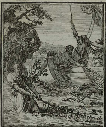
93. IOHANN. XXI. 11. Petrus plenum magnis piscibus rete, nec tamen ideo scissum, in terram attrahit. C. Weigel.