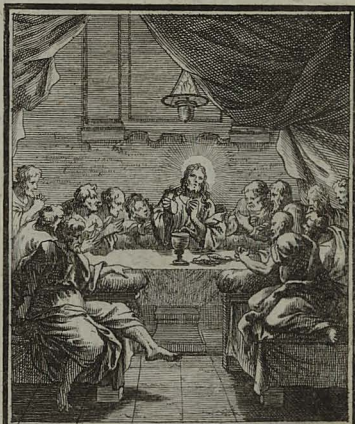
8. MATTH. XXVI. 26. 29. Panem benedicens fregit, & de- dit discipulis: similiter & cali- cem, gratias agens, dedit illis. C. Weigel