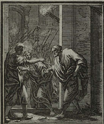
27. IOHANN. XVIII. 16. Petrum foras stantem, discipulus alius in conspectu ostiariae, de- ducit in atrium. C. Weigel.