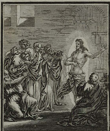
84. IOHANN. XX. 9. Per fores clausas, ad congregatos discipulos veniens, pramissa salu- te, vulnera monstrat. Cum Pr. S. C. M. C. Weigel.