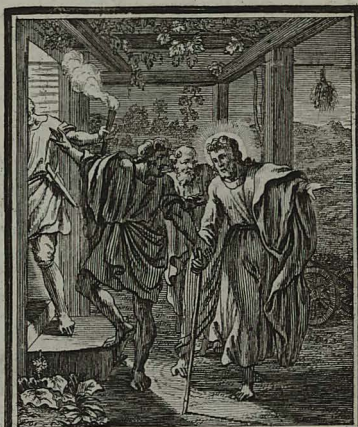
82. LUC. XXIV. 28. Discipuli Emmauitici JESUM longius itinun, ad diutius secum manendum compellant. C. Weigel.