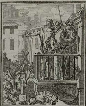
49. IOHANN. XIX. 5. 6. JESUM spinis coronatum, & purpuram indutum producit Pi- latus, & dicit: ECCE HOMO: Cham. Peric. 1. 5. C. M. C. Weigel.