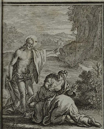
79. MATTH. XXVIII. 9. 10. Perterritis mulieribus salutem dicit, metumq; dispellens, in Galilaeam ad fratres ablegat. Cum Pr. S. C. M. C. Weigel.