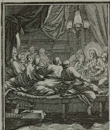
10. LUC. XXII. 24. 29. IESUS discipulos, statim post ce- nam de primatu litigantes se- vera admonitione corripit. Cum Pr. S. C. M. C. Weigel.