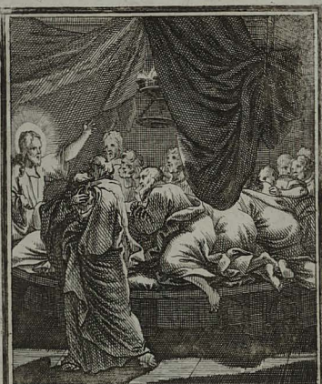
11. IOHANN. XIV. 15. 16. Dicit discipulis: Rogabo Pa- trem, & alium Paracletum dabit vobis, ut maneat vobiscum. Cum Pr. S. C. M. C. Weigel.