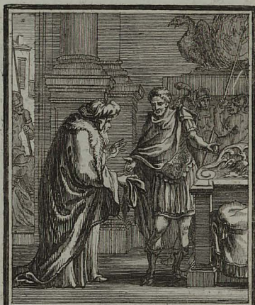
54. LUC. XXIII. 50. Joseph ab Arimathæa, qui erat decurio, accedens ad Pilatum, petit corpus JESU. C. Weigel.