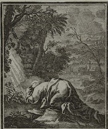
16. MATTH. XXVI. 39. Procidit in faciem orans: Pater, transeat a me calix iste, at non sicut ego volo, sed sicut tu vis. C. Weigel.