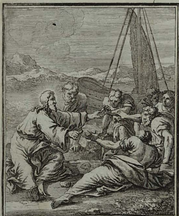
95. IOHANN. XXI. 13. JESUS accepto pane, discipulis illum manducandum porrigit; quod idem cum piscibus facit. C. Weigel.