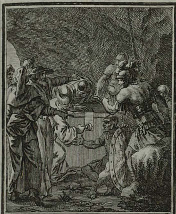
69. MATTH. XXVII. 65. Abentes Judæi, muniunt sepul- chrum, signantes lapidem cum custodibus.