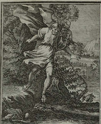
37. MATTH. XXVII. 3. 5. Proditor projectis in templum argenteis, recessit, & abiens la- queo se suspendit