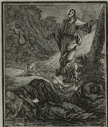
19. MAT. TH. XXVI. 43. 44. Rursum dormientes discipulos relinquens, abiit, & oravit tertio, eundem sermonem dicens.