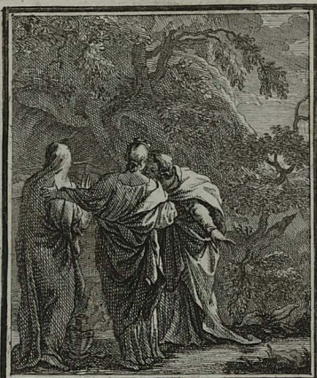
74. MARCI. XVI. 1. 2. 3. Mulieres JESU Corpus mortuum uncturae, de lapidis sepulchralis revolutione anxiae sunt. Cum Privileg. S. C. M. C. Weigel.