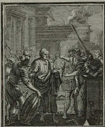
30. MATTH. XXVI. 69. 76. Petrus ab ancilla convictus, quod fuerit cum Christo, Iesum trina vi- ce multis dejectionib. abnegat. Cum Pr. Sp. C. M.