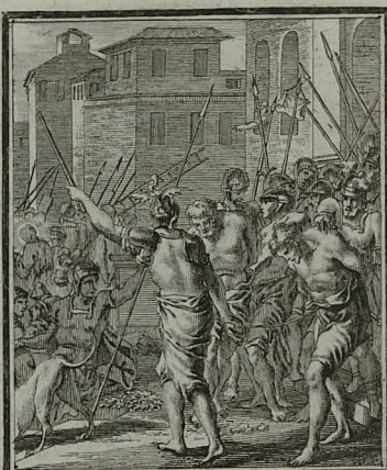
54. LUC. XXIII. 32. Præter Christum, deducuntur & alii duo malefici, ut cum eo interficerentur. Cum Pr: 15. C. M. C. Weigel