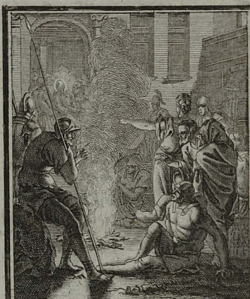
28. MATTH. XXVI. 58. Petrus sequitur Christum usque in atrium, ibique sedet cum mini- stris, ut videat finem. C. Weigel.