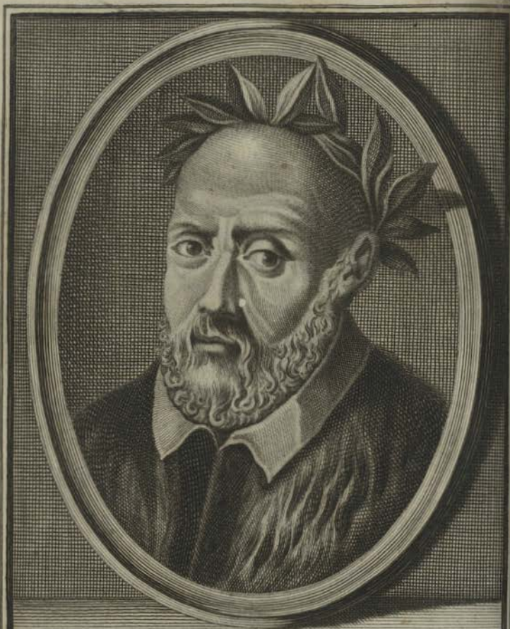
ANTONFRANCESCO GRAZZINI detto il L'ASCA POETA FIORENTINO